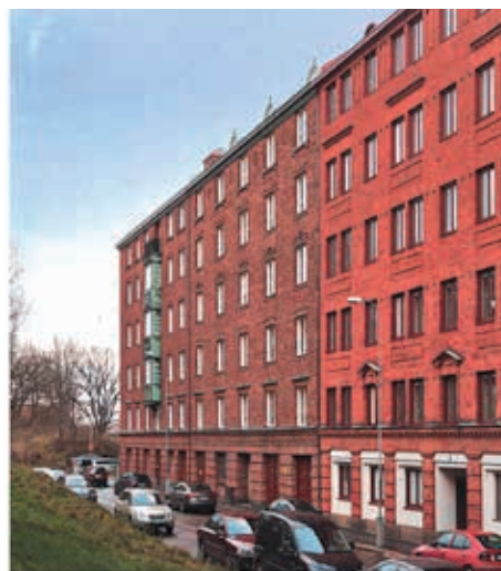
GÖTEBORG LORENSBERG 33:25