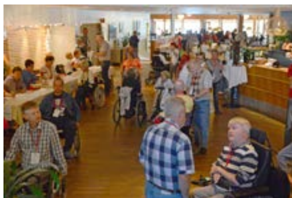
Mingel i foajén på Djurönäset där Neuroförbundets kongress hölls 2013.