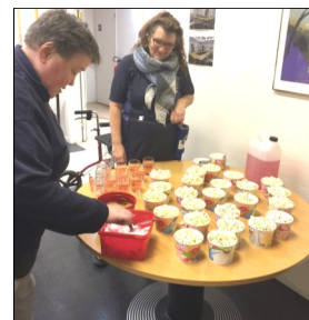
Nypoppade popcorn och dricka