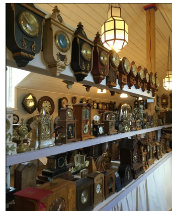
Klockmuseet i Skadom.

jobbat där var svårt att tro. Vi fortsatte förbi Nyland, en gång känt för sina sågverk, mot Torsåker. I Torsåker, Ytterlän-näs och Dal hölls 1674 -75, Sveriges största häxprocess, vilken orsakade att sjuttioen personer (c:a 10 % av socknarnas befolkning avrättades).