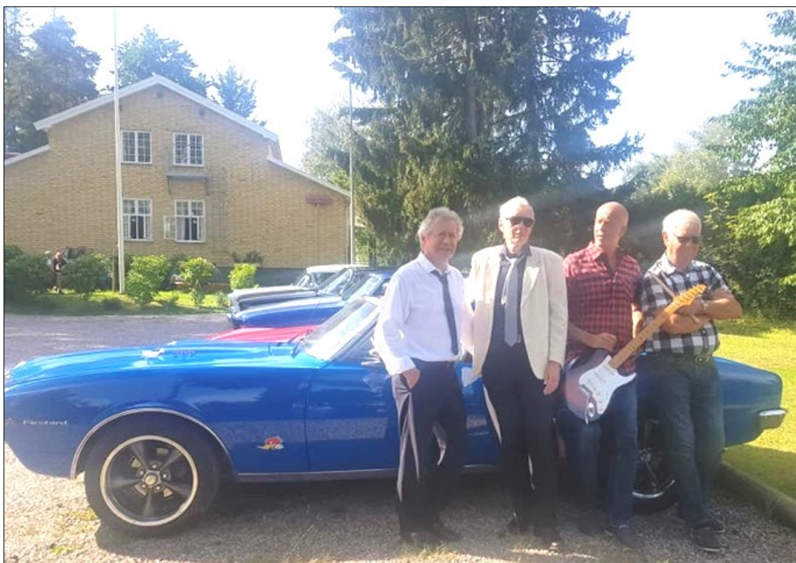
Sensommarfest den 31 augusti Bergsbrunna kamratgård, "Young once".

Medlemsbladet från Neuro Uppsala-Knivsta