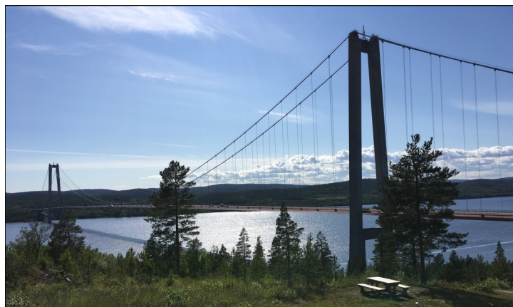
Höga kustenbron.

Nästa anhalt var Härnösand. Där besökte vi Härnösands bilmuseum. Där visas 200 bilar plus lite andra fordon, sorterade efter olika teman, exempelvis folkhemsbilar, amerikana och 40-tal. Man hade också ställt upp lite skyltdockor så man kunde se hur de som åkte i respektive fordon hade sett ut. Styrkta med lite ny och nyupplivad kunskap åkte vi mot den 1867 meter långa